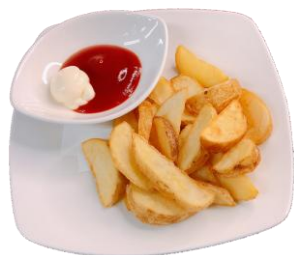
皮付きポテトフライ