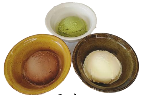
アイス (バニラ・チョコ・抹茶) 各400円