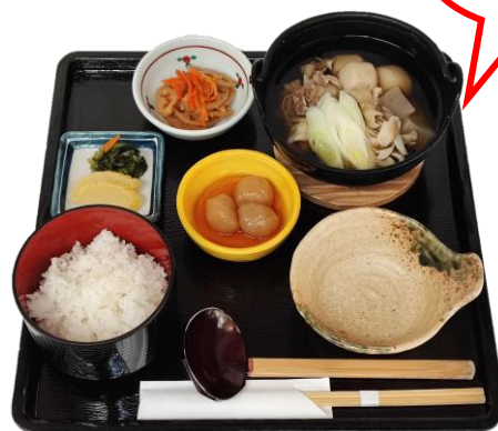
山形名物 芋煮定食