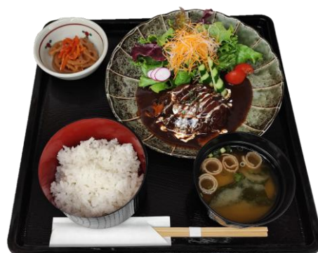
ビーフハンバーグセット (山形牛入り)