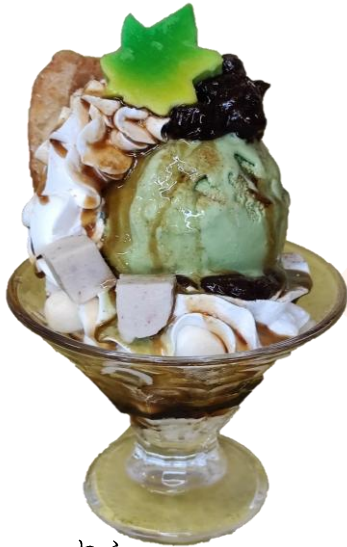
わふー 和麩パフェ 800円

東根市特産の「麩」を使ったパフェ。まめ麩、生麩、麩ラスク、いろんな食感が楽しめます 抹茶アイス、黒蜜、きなこで和風なパフェです