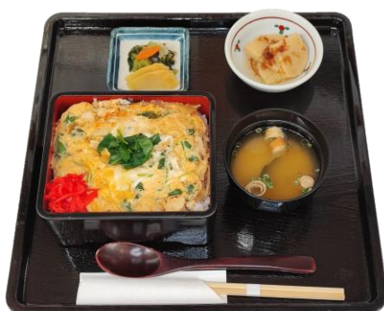
親子重(山形県産ハズ鶏と赤がら卵使用)