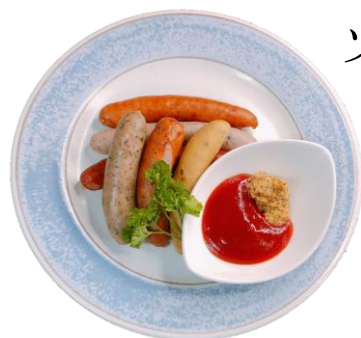
ソーセージ盛り合わせ