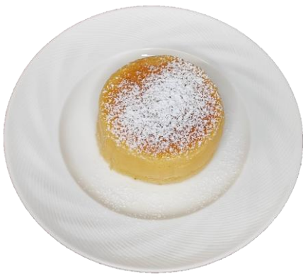
スフレチーズケーキ 500円