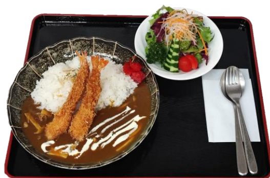
海老フライきのこカレー