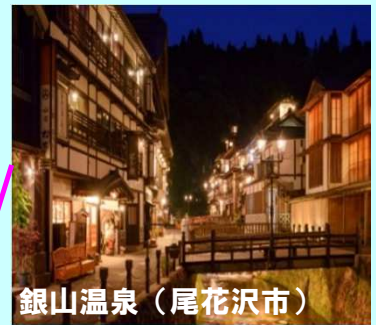
銀山温泉（尾花沢市）