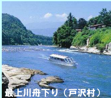
最上川舟下り（戸沢村）