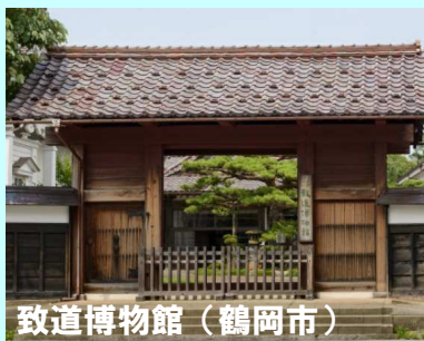
致道博物館（鶴岡市）