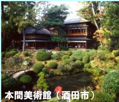
本間美術館（酒田市）