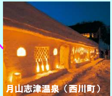
月山志津温泉（西川町）