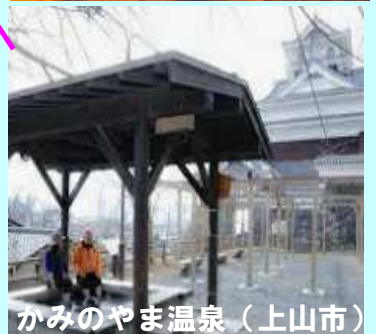
かみのやま温泉（上山市）