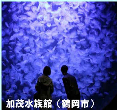
加茂水族館（鶴岡市）