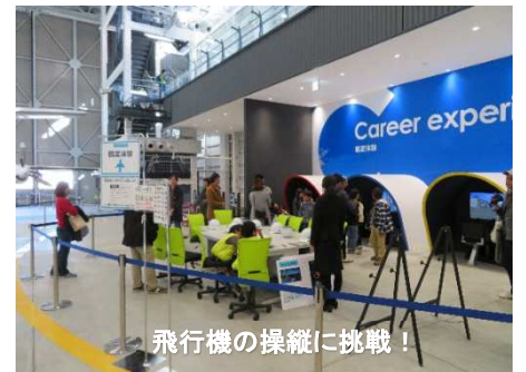
飛行機の操縦に挑戦！