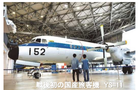
戦後初の国産旅客機 YS=11

県営名古屋空港…(バス約 2 分または徒歩約 10 分)…あいち航空ミュージアム( https://aichi-mof.com/ )