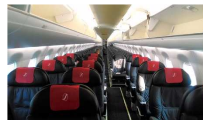
クラスJは横3列で広々！