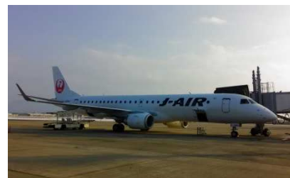
よく見るとやはりボディが長い！

現在は、伊丹空港から鹿児島、仙台、福岡の路線のみで運航されております。山形にも早く就航して欲しい！