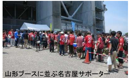
山形ブースに並ぶ名古屋サポーター