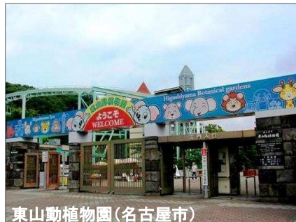
東山動植物園(名古屋市)