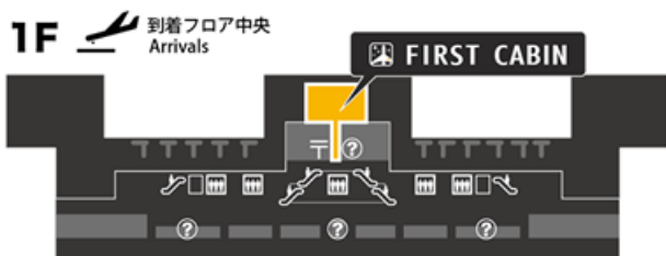
第1旅客ターミナル Terminal 1