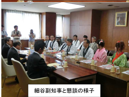
細谷副知事と懇談の様子