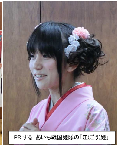
PRする あいち戦国姫隊の「江(ごう)姫」