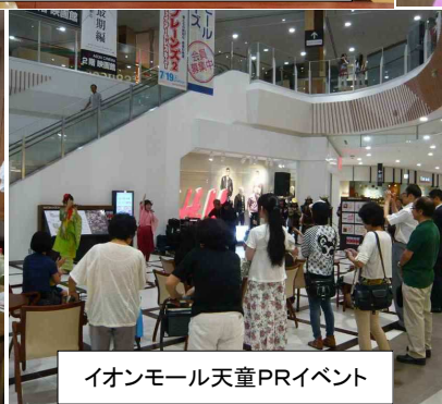
イオンモール天童PRイベント

あいち戦国姫隊とは・・・ 群雄割拠の戦国時代、愛知に生きた6人の姫たちが、遙か400年の時を超え、現代に甦り、武将のふるさと愛知をPR！ まつ：前田利家正室 江(ごう)：お市の三女、織田信長の姪、江戸幕府二代将軍・徳川秀忠正室