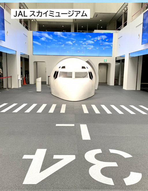
JAL スカイミュージアム