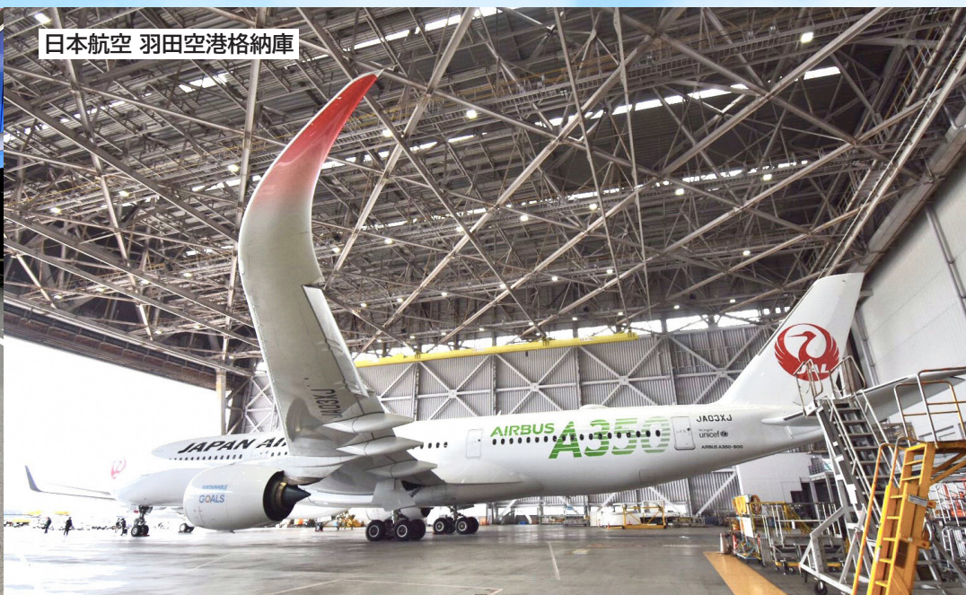
日本航空 羽田空港格納庫