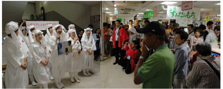
名鉄百貨店本店(名古屋市)では、白装束姿でさくらんぼをPR