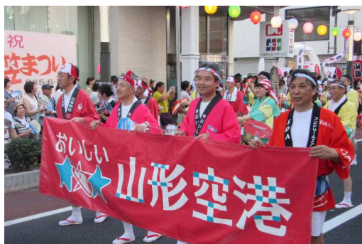
昨年のおいしい山形空港チーム