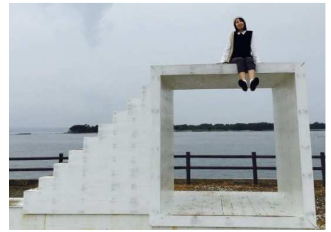
アート作品「イーストハウス」でパシャリ！

愛知県航空対策課で空港の利用促進を担当。県営名古屋空港関係者で結成したバンドの一員（キーボード）としても活躍中。今月号からライターに仲間入りしていただきました。