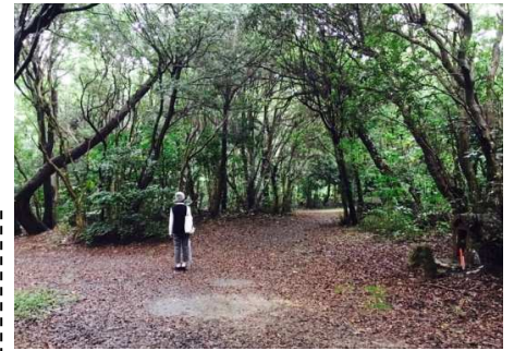
自然もアート作品の一部です。