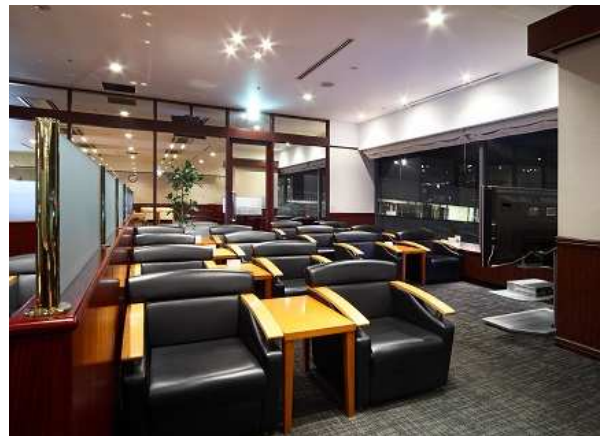
第1ターミナル南側ラウンジ