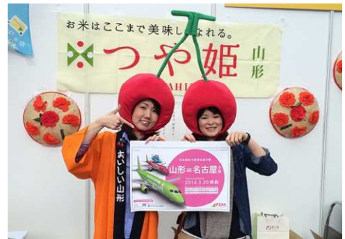
山形県職員と愛知県職員による共同PR (名古屋便PRイベントにて)