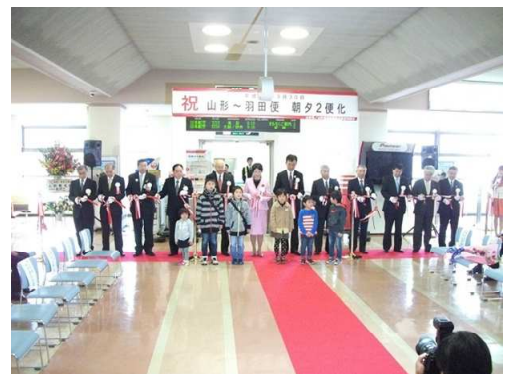
東京便2便化を記念してテープカット

山形空港利用拡大推進協議会では、第1四半期(4~6月)の利用目標として、東京便:62%~67%の高いレベル、名古屋便:70%を掲げています。会員の皆様の引き続きの積極的なご利用を改めてお願い申し上げます。