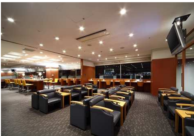
第1ターミナル北側ラウンジ

企業会員の皆様に、羽田空港エアポートラウンジ(第1旅客ターミナル)をご用意しました。「企業会員証」と「山形羽田便搭乗券(当日分)」を同ラウンジ受付にてご提示ください。 会員ご本人に限り、通常は1030円/回のところ、無料となります。 羽田空港発着の多彩な航空機を眺めながら、フリードリンクサービス付のゆったりした環境で、お仕事に、出張の疲れ回復に、ぜひ御利用ください。