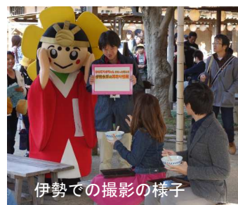
伊勢での撮影の様子