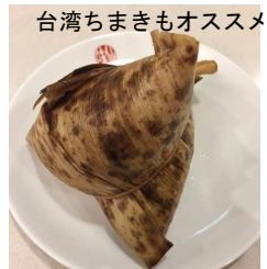
台湾ちまきもオススメ

愛知県の多くのラーメン店でも味わっていただけますが、オススメは、元祖台湾ラーメンの店、「味仙 みせん 」です。本店は、今池にあります。チェーン店で、名古屋駅の「うまいもん通り」にも店舗を構えています。