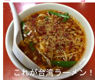
これが台湾ラーメン！

愛知県の食といえば、なごやめし。そんななごやめしの中から今回紹介するのは、「台湾ラーメン」です。台湾！？と思われるかもしれませんが、名古屋オリジナルなんです。ニンニクや唐辛子がきいた辛口のミンチ肉がトッピングされたもので、辛いのが好きな人にとってはたまらない一品です。