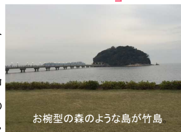
お椀型の森のような島が竹島

◇竹島水族館 HP: http://www.city.gamagori.lg.jp/site/takesui/