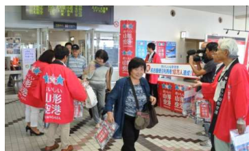
搭乗者全員にプレゼント

また、達成した便の搭乗者全員に山形県産のお菓子とジュースをプレゼント。一緒にお祝していただきました。