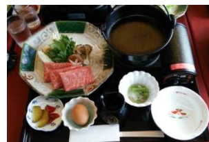
山形牛すき焼きセット

9月1日より、「山形牛すき焼きセット」（通常 2,800 円）が会員限定で2割引きの 2,240 円（H29.3.31 まで）、「山形牛牛井温玉のせ＋名月荘特製うどん」（通常 1,800 円）が 1,080 円（H28.10.18 まで）でお楽しみいただけます。今後も様々なサービスメニューをご用意する予定ですので、皆様お楽しみに！