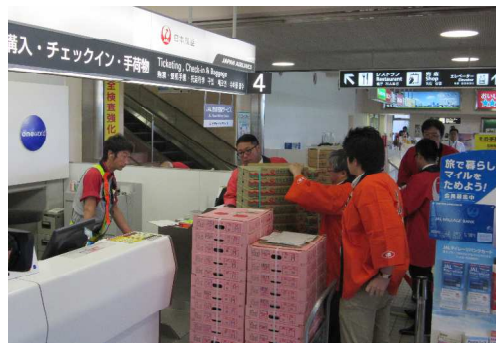
さくらんぼ航空貨物の受付

会場では、ミスさくらんぼが華を添え、ペロリン、チェリン、タント君もセレモニーを盛り上げ、参加者全員で羽田に飛び立つさくらんぼを見送りました。