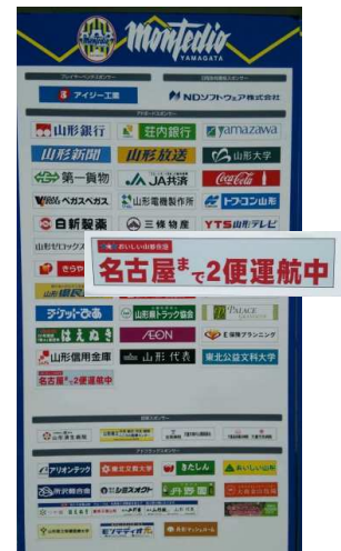
6/4の横浜FC戦から、ゴール裏にアドボード設置！

今後、アウェイゲームの際のモンテサポーターの皆さんのご移動に、さらには、ホームゲームの際の相手チームサポーターの皆さんのご移動に、おいしい山形空港発着の航空便をもっともっとご利用いただこうと、NDソフトスタジアムで行われるホームゲームにおいて、おいしい山形空港の利用をPRしてまいります。サポーターの皆さんと一緒に、試合も搭乗率も盛り上げていきますよ～！！