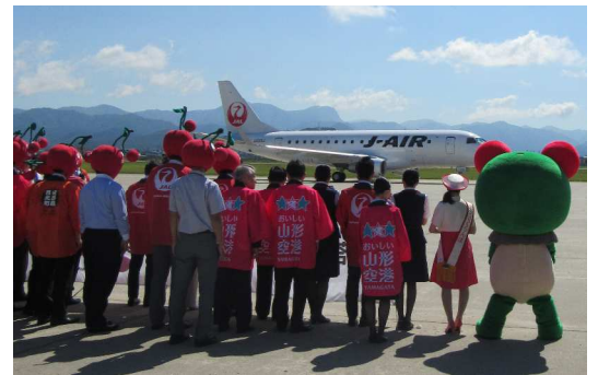
出発便をお見送り！