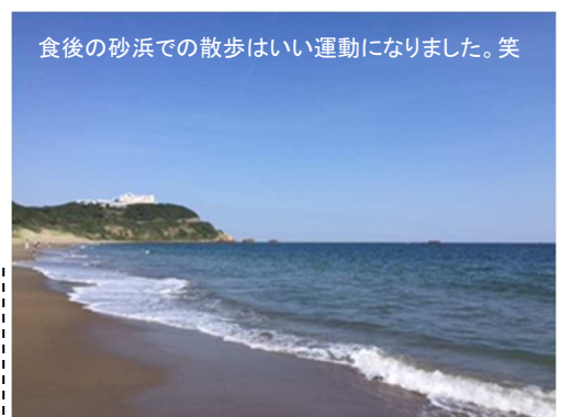
食後の砂浜での散歩はいい運動になりました。笑