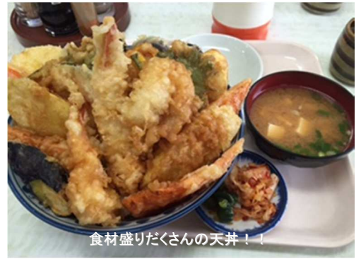
食材盛りだくさんの天丼！！

H26年度まで航空対策課に所属(現在は県教育委員会配属)。H27.3には山伏ジェット第1弾に参加いただきました。