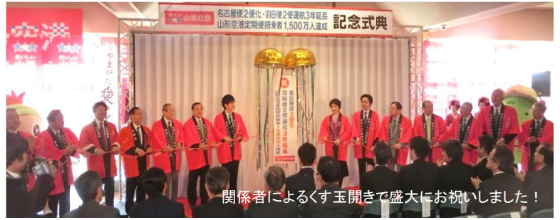
関係者によるくす玉開きで盛大にお祝いました！

3月27日(日)、おいしい山形空港において、名古屋便2便化、羽田便2往復運航3年延長、定期便搭乗者1,500万人達成を記念した式典が行われました。