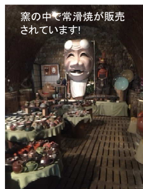
窯の中で常滑焼が販売されています！