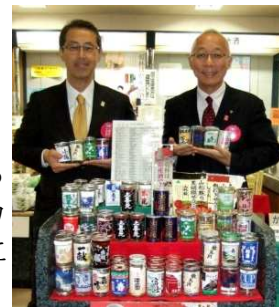
おいしい山形空港事務所長(左)とおいしい山形空港ビル専務(右)がおススメ中のワンカップたち♪

54もの酒蔵がある山形県。おいしい水と米、そして高い技術が揃う山形のお酒は、様々なコンテストで金賞を受賞し人気急上昇中です。空港売店「さくらんぼ」では、もっと手軽にいろいろな酒蔵のお酒を味わっていただきたいという思いから、新たに、県内一円約 40 種類のワンカップ酒の販売を始めました。味わいも様々。山形産のおつまみと一緒にビジネス帰りの一杯にいかがでしょうか。お土産にまとめ買いされる方も続出中ですよ！