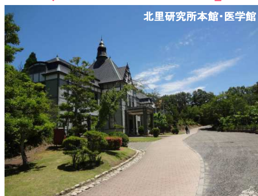
北里研究所本館・医学館