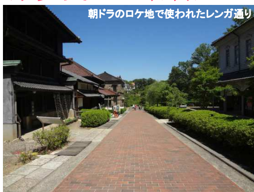
朝ドラのロケ地で使われたレンガ通り