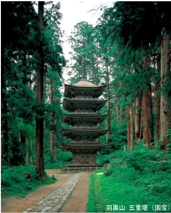
羽黒山 五重塔 (国宝)

江戸時代、「西の伊勢参り」と“対(つい)”をなし、「東の奥参り」と呼ばれた山形県の出羽三山には、年間15万7千人もの人々が参拝に訪れたとあります。また、“人生儀礼”として、伊勢神宮の「陽」と出羽三山の「陰」の両方を登拝した者は、特別の存在(神となることを約束された者)として崇められたとされています。